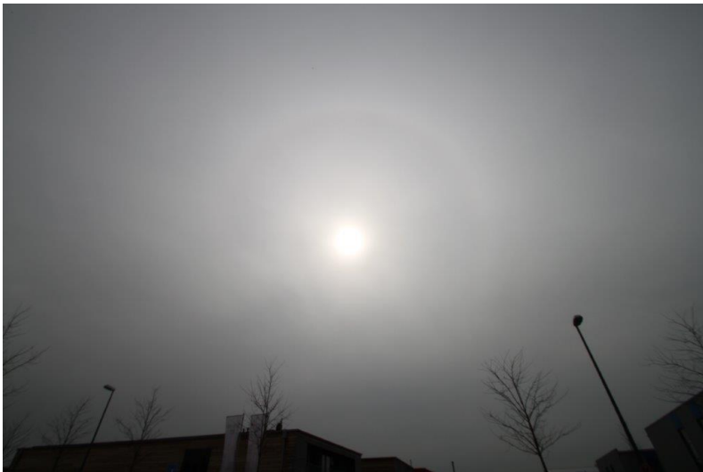
Mysterienraum (Themen: Schuldbewusstsein, Schlechtes Gewissen, Siegel von Mysterienschulen), erschienen von 14.30 Uhr – je nach Region ca. 18.00 Uhr am 8.4.13