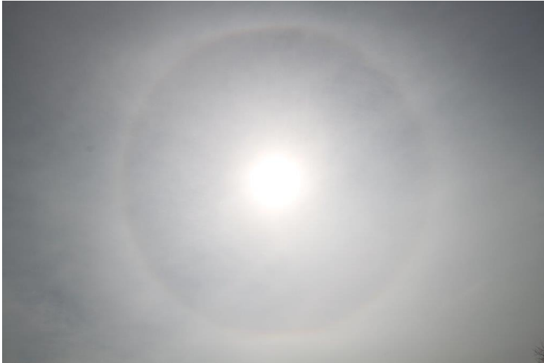
Verantwortungsraum (Thema: Schöpferkraft für das Allgemeinwohl), erschienen von 13.30 Uhr – ungefähr 14.30 Uhr am 8.4.13