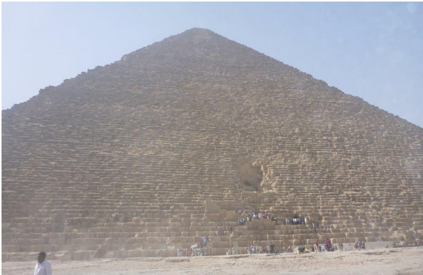
(Ägypten, Kairo – große Pyramide, 2012)

Dieses Rätsel aus der Vorzeit, zieht sich über die ganze Welt und betrifft eben nicht nur Pyramiden, sondern Tempelanlagen und Steinreihen wie in Carnac (Frankreich) und alle anderen Megalithbauten, wie auch Stonehenge, gleichermaßen. Irgendetwas hat unsere Vorfäter quer durch alle Zeitalter zu wahnwitzigen Anstrengungen veranlasst. Wenn sie jedoch anscheinend meist keinen Kontakt miteinander hatten (sie waren nicht nur durch die Entfernungen, also Raum, sondern auch durch die Zeit getrennt), scheint sie jedoch ein gemeinsamer Drang miteinander zu verbinden. Doch was war das? Geschah das alles zu Ehren „der Götter“? Gibt es hinter all dem einen großen Plan, zu dem die einzelnen Zivilisationen ihren Teil beigetragen haben?