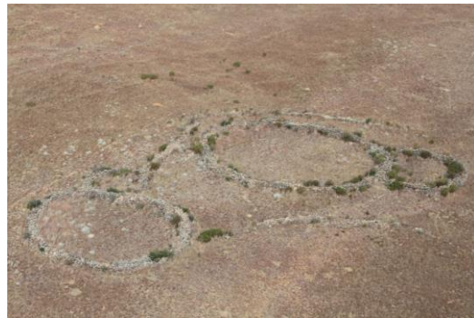
Beispiele der Steinkreise in Südafrika (fraktale Muster)