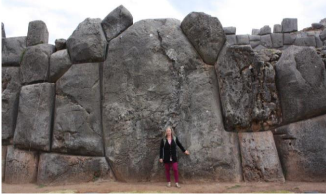
(Peru, Sacsayhuamán 2010)

die sich auch in Sacsayhuamán (Peru), in Teotihuacan (Bolivien) und ... in angewandt wurden, nämlich ohne Mörtel und nicht auf allen Seiten schön gerade, sondern in verschachtelter Bauweise. Die ältesten Mauern, also die untersten, weisen die größten verwendeten Steine auf, die viele Tonnen Gewicht haben.