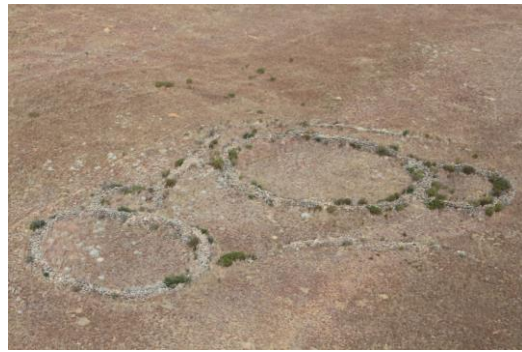
Beispiele der Steinkreise in Südafrika (fraktale Muster)

Da sich meine Geistige Führung eine unglaubliche Mühe gemacht hat, mich dorthin zu bringen (auf ungewöhnlichem Wege wurde nämlich auch das Geld dafür zur Verfügung gestellt), war ich gespannt darauf, ob meine Informationen darüber richtig sind. Ich „sah“, dass die Kreise Stellen aufzeigten, an denen man direkten Zugang zur Akasha, also zum Weltgedächtnis finden kann und es bestätigte sich, da ich jede Nacht anscheinend darin „surfte“, als ich vor Ort war und dadurch phantastische Geschichten miterleben konnte. Aber die Bedeutung dieser Kreise geht noch darüber hinaus, denn Mr. Tellingers Theorie geht dahin, dass sie ein Energiebündelungs- und Weiterleitungsnetz darstellen, wenn er auch nichts davon erzählt, wofür diese Energie dienen könnte. Er bringt die Kreise jedenfalls mit den Anunaki in Verbindung, jenen Wesen, die laut sumerischer Aufzeichnungen aus dem vorhandenen Genmaterial ihrer eigenen Rasse und dem, was die Ur-Menschen damals zu bieten hatten, eine Sklavenrasse zum Schürfen von Gold erschufen, welches sie danach zu ihrer Heimat Nirbiru schafften. Dort wurde es gebraucht, um mit Hilfe des Goldstaubes, die Atmosphäre zu sichern. Man mag davon halten, was man will, Tatsache ist, dass in Südafrika Hunderte von uralten Minenschächten gefunden wurden, von denen niemand weiß, wer sie baute oder wo all das Gold geblieben ist.