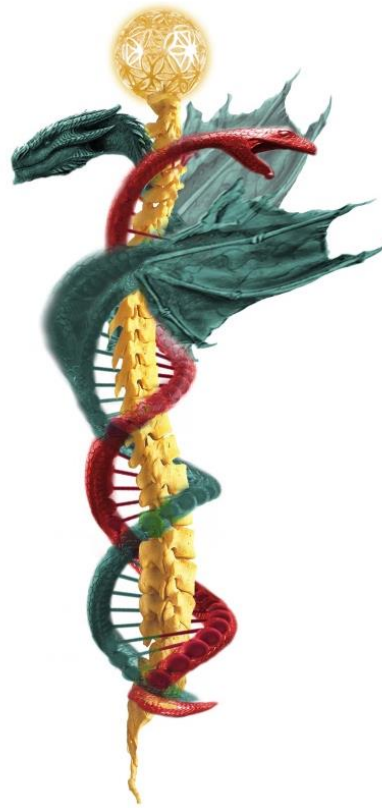
DNS, Kundalini (Schlange) und Aphora (Drache) mit der Blume des Lebens, vereint in einem Symbol

Wir werden uns daher mit der 360-Strang-DNS ebenfalls intensiv befassen. Viele Symbole, die wir heute kennen, finden sich als Sonderkristalle in einigen Chakren wieder. Diese müssen nicht einen zusammenhängenden Motor bilden, wie wir sie von den acht Lichtkörpern kennen, können jedoch einzeln genauso viel Kraft wie solch ein Motor aufweisen.